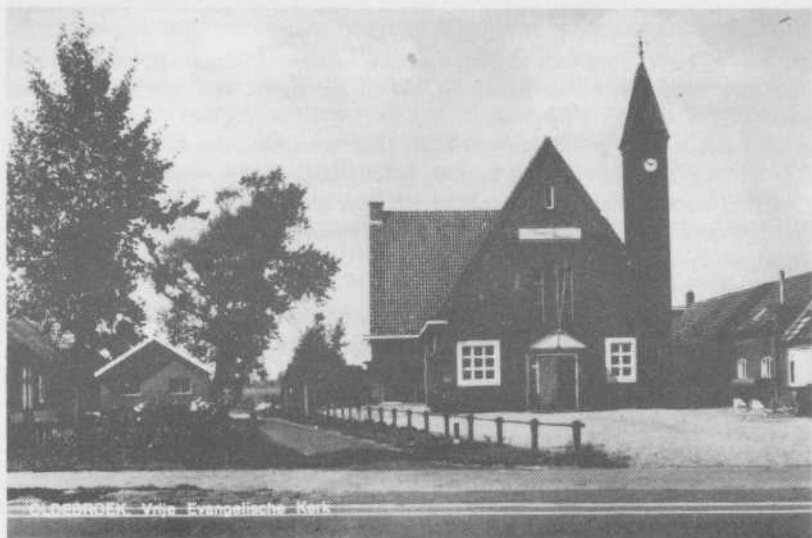
50 Jaar Vrije Evangelische Kerk