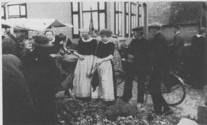
De markt in Oldebroek 1940

De typische klederdracht werd toen nog behoorlijk veel door de ouderen gedragen. Dat zal nu wel haast voorbij zijn. Wel jammer! De bouw der huizen en 't interieur zijn nu ook aan deze tijd aangepast. Zo omstreeks 1950 was dat meestal nog wel even anders.