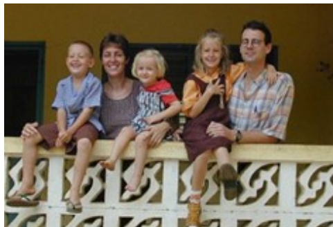
The Blues Family 2000

Lieve broeders en zusters van de Vrije Evangelische Gemeente in Oldebroek,