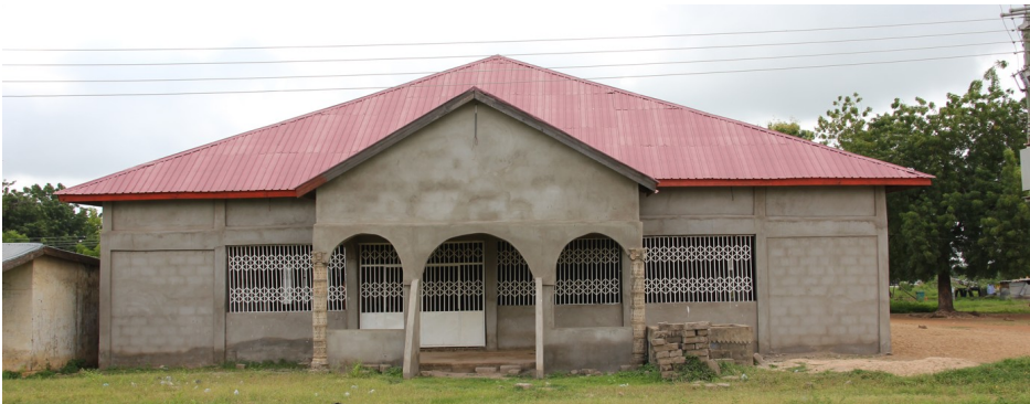
New Turner Memorial Church 2019