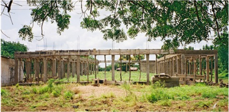
New Turner Memorial Church 2004

Tijdens de dienst werd ons gevraagd u hartelijk te bedanken voor het aandeel dat de VEG Oldebroek/Elburg gehad heeft in het tot stand komen van een nieuw kerkgebouw voor de Assemblies of God in Saboba, Ghana. Bij deze doen wij dat natuurlijk graag.