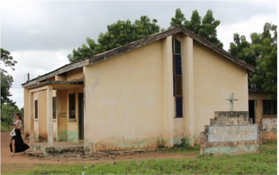
Turner Memorial Church 2000

Gelukkig zagen niet alleen wij, maar ook de kerkleiding in dat een groter gebouw geen overbodige luxe zou zijn. U, als VEG Oldebroek/Elburg hebt toen middels de opbrengst van een dankdagcollecte in 2001 er voor gezorgd dat een begin kon worden gemaakt met de bouw van een nieuw kerkgebouw. Als gezin waren wij net teruggekeerd uit Ghana. Sindsdien zijn wij inmiddels 3x terug geweest in Saboba. In die jaren hebben wij de nieuwe kerk langzaam vorm zien krijgen. U moet begrijpen dat bouwen in Ghana een heel andere zaak is, als in Nederland. Men wacht daar niet tot de hele financiering rond is, maar men begint zodra er wat geld beschikbaar is en stopt als het geld op is. Zo kan de bouw jaren stilliggen totdat er weer geld beschikbaar is.